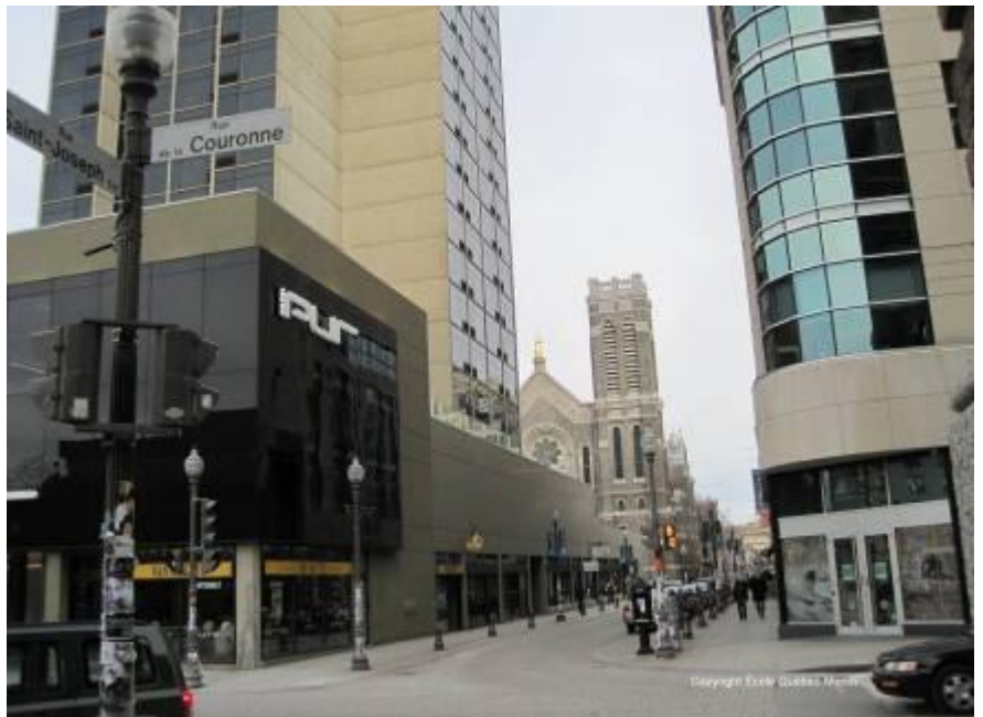
En sortant de l'école, sur la rue Saint-Joseph

Tous les étudiants doivent passer un test de classement dès le premier jour à École Québec Monde. Un test écrit est suivi d'une entrevue en face à face. Nous utilisons à la fois le test écrit et l'entrevue pour évaluer le niveau des étudiants de manière à placer chacun d'eux dans le groupe approprié ou pour concevoir le programme d'étude idéal selon leurs besoins et objectifs.